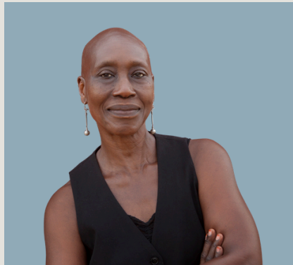
Germaine Acogny DANSE SÉNÉGAL

Un jour, Maurice Bédart t'a donné un conseil. Je te le répète aujourd'hui, pour que tu n'oublies jamais qu'il faut que tu en fasses une philosophie qui t'accompagnera toute ta vie : il faut être enracinée pour pouvoir s'élever vers le ciel. Sur scène, cela veut dire qu'il faut renforcer ses appuis, suffisamment s'ancrer dans le sol pour parvenir à s'élancer en hauteur. Dans la vie, c'est pareil : connais-toi, assume-toi, aime-toi suffisamment pour pouvoir t'accomplir. Fie-toi à tes racines, elles ne te lâcheront jamais.